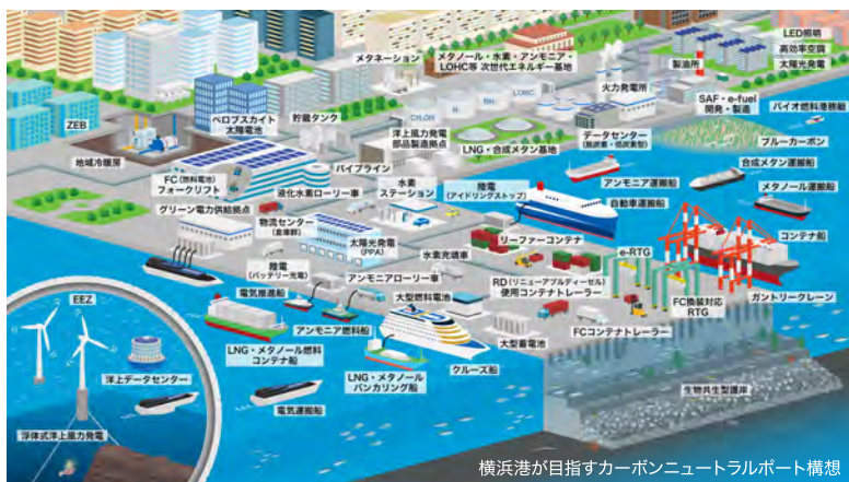
横浜港が目指すカーボンニュートラルポート構想