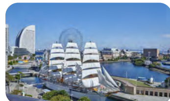
国指定重要文化財帆船日本丸

開港以来、海とのつながりの中で 発展を遂げてきた横浜。人々が海や港に親しみ、 海に関わる幅広い企業や研究機関等が集積している 横浜の特徴をいかして、海洋に関する活動拠点 「海洋都市横浜」の実現を目指しています。