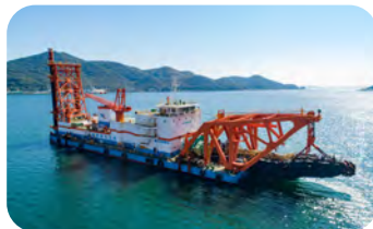
作業船 第三亜細亜丸/東亜建設工業